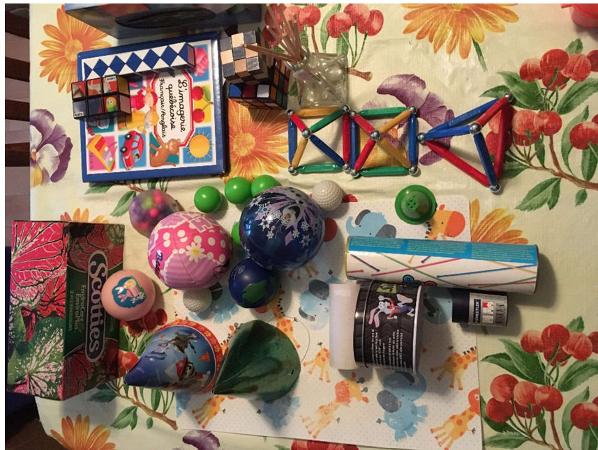
Exemples d'objets récupérés par des enfants de 1 re année

Exemples d'objets : bibelot d'une pyramide maya, module de parc